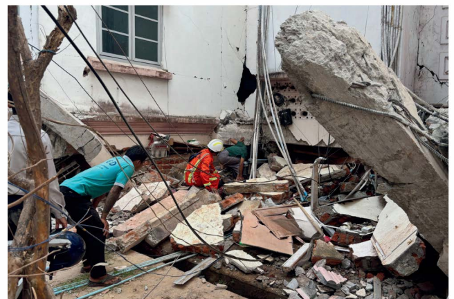
Gwirfoddolwyr yn chwilio am oroeswyr ger adeilad sydd wedi'i ddifrodi yn Naypyitaw, Myanmar.

Gweddiwn yn enw ein Harglwydd Iesu Grist. Amen!