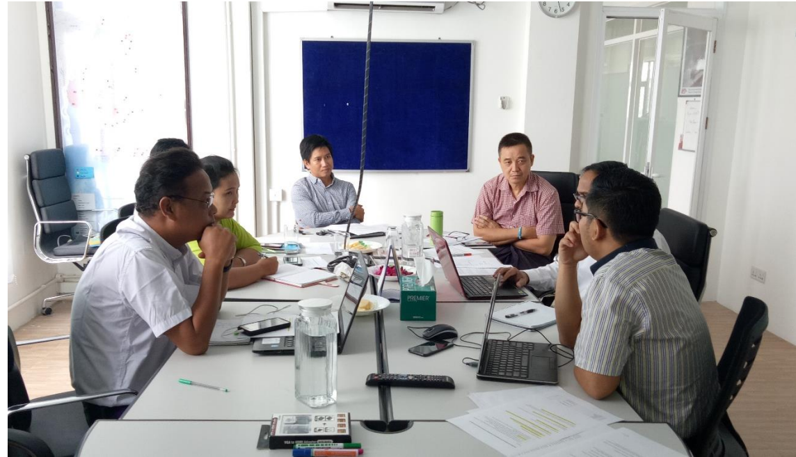
အမျိုးသားအဆင့် ဦးဆောင်ကော်မတီ အစည်းအဝေး - မြန်မာနိုင်ငံ

လမ်းကြောင်းမှာ နိုင်ငံတကာ အဖွဲ့အစည်းများထံမှ လုပ်ငန်းဆောင်ရွက်မှုဆိုင်ရာ ကိစ္စရပ်များကို အကြွင်းမဲ့ လွှဲပြောင်းပေးမှု ဖြစ်သည် ဟူ၍ ယုံကြည်သည်။ ဤအကြောင်းအချင်းအရာက နိုင်ငံတကာ အစိုးရမဟုတ်သော အဖွဲ့အစည်းများ နှင့် နိုင်ငံတကာ လူသားချင်းစာနာထောက်ထားမှုဆိုင်ရာ အဖွဲ့အစည်းများ အနေဖြင့် လူသားချင်းစာနာ ထောက်ထားမှုဆိုင်ရာ အစီအစဉ်များနှင့် မိတ်ဖက်ပြုမှုများ၏ ရေတိုလှုပ်ရှားဆောင်ရွက်နေသည့် အချိန်မူဘောင်ကို ကျော်လွန်၍ စဉ်းစားရမည် ဖြစ်သည်။ ရေရှည်ဖွံ့ဖြိုးတိုးတက်ဆောင်ရွက်မှုများတွင် သဘာဝဘေးအန္တရာယ်ဆိုင်ရာ ကြိုတင်ပြင်ဆင်မှု၊ ဒေသတွင်းနှင့် အမျိုးသားအဆင့် အဖွဲ့အစည်းများ၏ စွမ်းဆောင်ရည် မြှင့်တင်မှု၊ မိတ်ဖက်ပြုမှုဆိုင်ရာ ဖွံ့ဖြိုးတိုးတက်မှုနှင့် ဘာသာဝဘေးအန္တရာယ် ဖြစ်လွယ် သည့် ဒေသများတွင် ဘက်ပေါင်းစုံ ဖွံ့ဖြိုးတိုးတက်အောင် ဆောင်ရွက်မှုတို့ပါဝင်ပြီး တစ်ဖက်တွင် အပြီး ပိုင် စွန့်ခွာမှုနှင့် လွှဲပြောင်းမှုတို့အတွက် အစီအစဉ်များ ပြုလုပ်ဆောင်ရွက်ရမည် ဖြစ်သည်။၏