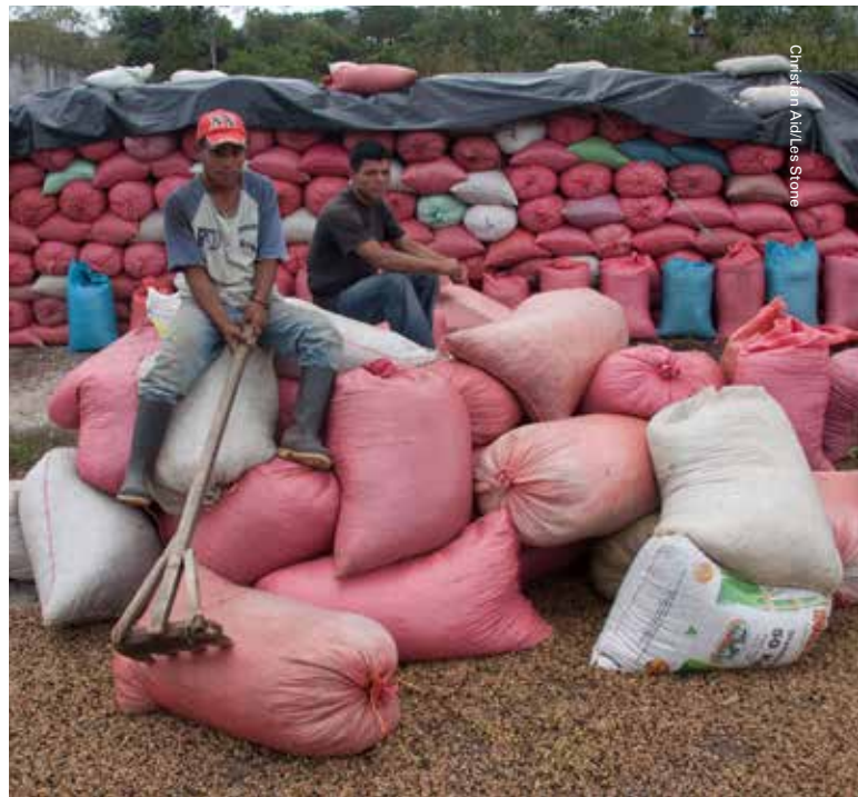
Christian Aid/Les Stone

Los programas de acción humanitaria y de acceso a mercados financiados por el Dfid (2011-2014), así como el Programa de financiamiento del gobierno de Irlanda (2012- 2015) para Guatemala y El Salvador, proveen una plataforma para el trabajo futuro sobre resiliencia y participación ciudadana.