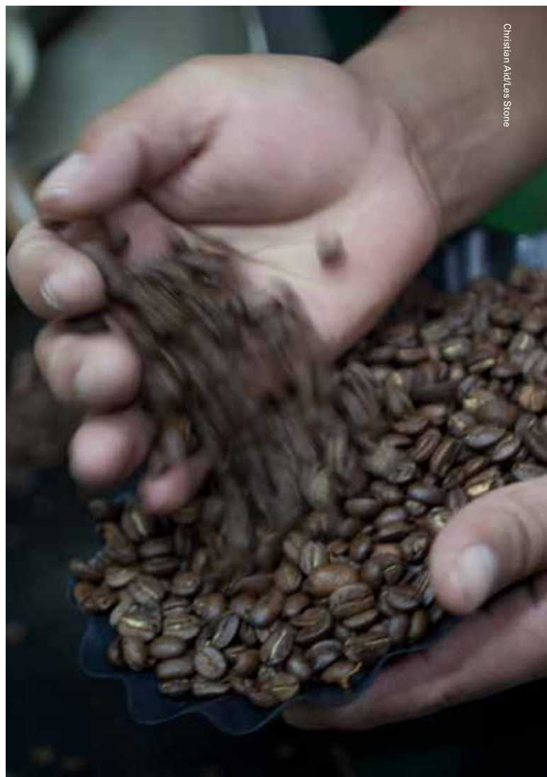
Christian Aid/Les Stone