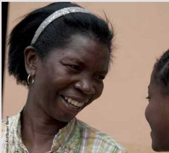
Christian Aid/Susan Barry

En República Dominicana, migrantes haitianos/as y sus descendientes son víctimas de maltrato frecuente. MUDHA, una contraparte de Christian Aid, tiene una larga trayectoria de lucha contra la exclusión de dominicanos/as de descendencia haitiana en la sociedad. Esta es una lucha larga pero está logrando algunos cambios dentro de las comunidades. Dirigida por personas domínico-haitinas y trabajando para ellas, defendiendo sus derechos legales – por ejemplo el derecho a un nombre y una nacionalidad – haciendo campañas por la justicia y trabajando para garantizar los servicios básicos para las personas que de otra manera no tendrían acceso a la educación y a la atención médica.